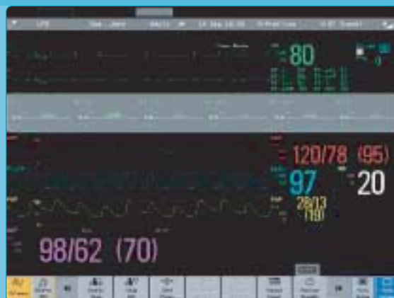
Trendy horyzontalne odcinka ST.

Dzięki paskom trendu horyzontalnego (po prawej), odchylenia poziomu odcinka ST są łatwe do zauważenia.