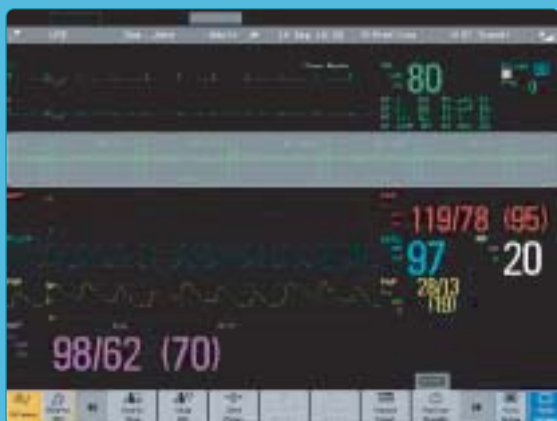
Trendy graficzne odcinka ST.

Dzięki paskom trendu horyzontalnego (po prawej), odchylenia poziomu odcinka ST są łatwe do zauważenia.