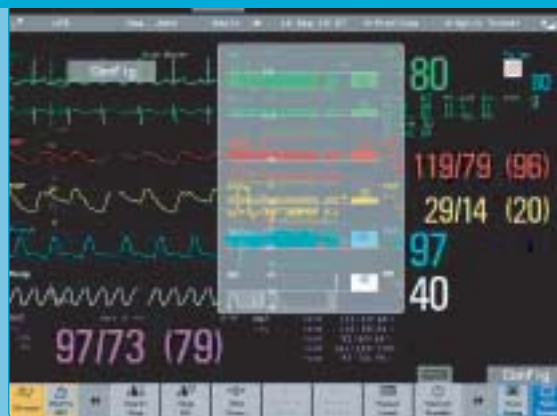
Ekran podzielony w pionie z trendami horyzontalnymi.

Prosimy zwrócić uwagę, w jaki sposób trendy graficzne (z lewej) przedstawiają zmiany stanu pacjenta w czasie, wówczas gdy trendy horyzontalne (po prawej) koncentrują się na ogólnej tendencji zmian stanu pacjenta. Strzałka trendu horyzontalnego ułatwia szybką identyfikację odchylenia wartości parametru pacjenta.