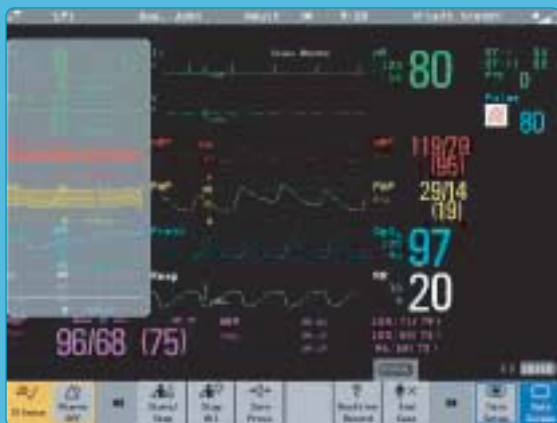
Trendy graficzne widoczne w lewej części ekranu podzielonego.

Pasek trendu horyzontalnego jest zawsze wyświetlany wraz z pomiarami, których trend jest przedstawiany (po prawej). Trend graficzny jest opcjonalny. Strzałka wskaźnika trendu pojawia się tylko wówczas, gdy istnieje wyraźna tendencja zmian stanu pacjenta. Ponadto, aby ocena była możliwa, pacjent musi posiadać 10-minutowy zapis parametrów.