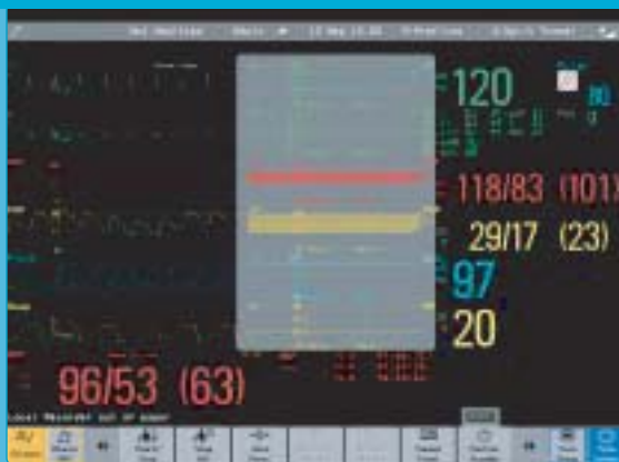
Ekran podzielony w pionie z trendami graficznymi.

Ekran monitora pacjenta IntelliVue są wyjątkowo elastyczne w konfiguracji. Poniżej przedstawiamy tylko kilka przykładów możliwych do utworzenia konfiguracji: