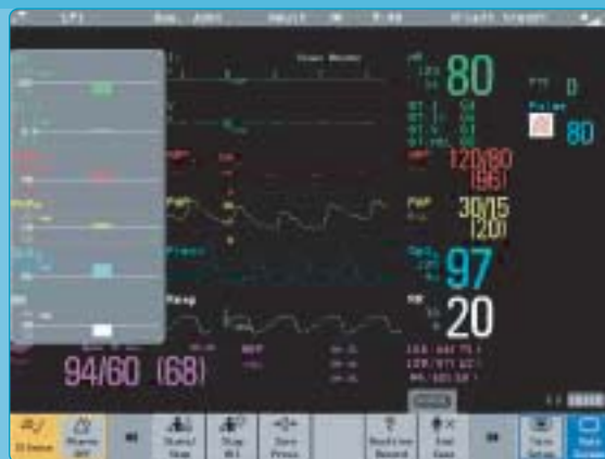
Paski trendu horyzontalnego ze wskaźnikami trendu widoczne w lewej części ekranu podzielonego.

Pasek trendu horyzontalnego jest zawsze wyświetlany wraz z pomiarami, których trend jest przedstawiany (po prawej). Trend graficzny jest opcjonalny. Strzałka wskaźnika trendu pojawia się tylko wówczas, gdy istnieje wyraźna tendencja zmian stanu pacjenta. Ponadto, aby ocena była możliwa, pacjent musi posiadać 10-minutowy zapis parametrów.