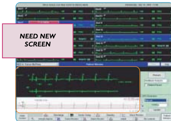
Analiza arytmii z opisami pobudzeń i konfigurowanymi przez użytkownika progami detekcji QRS.